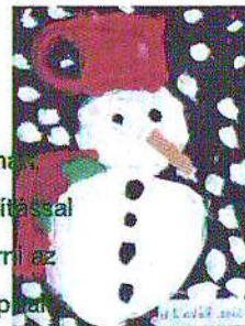
Jász Réka 2.b