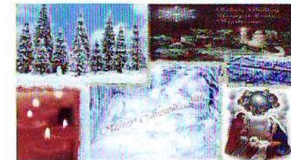
Pusztafi Viktória 6.o.