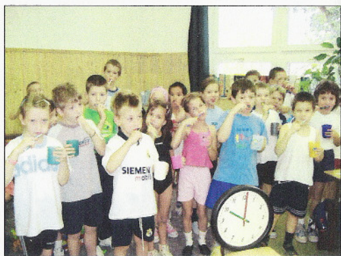
Fogat mosnak az 1.a tanulói