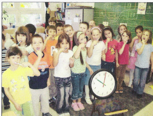
Az 1.b osztály tanulói ugyanakkor mosnak egyszerre fogat